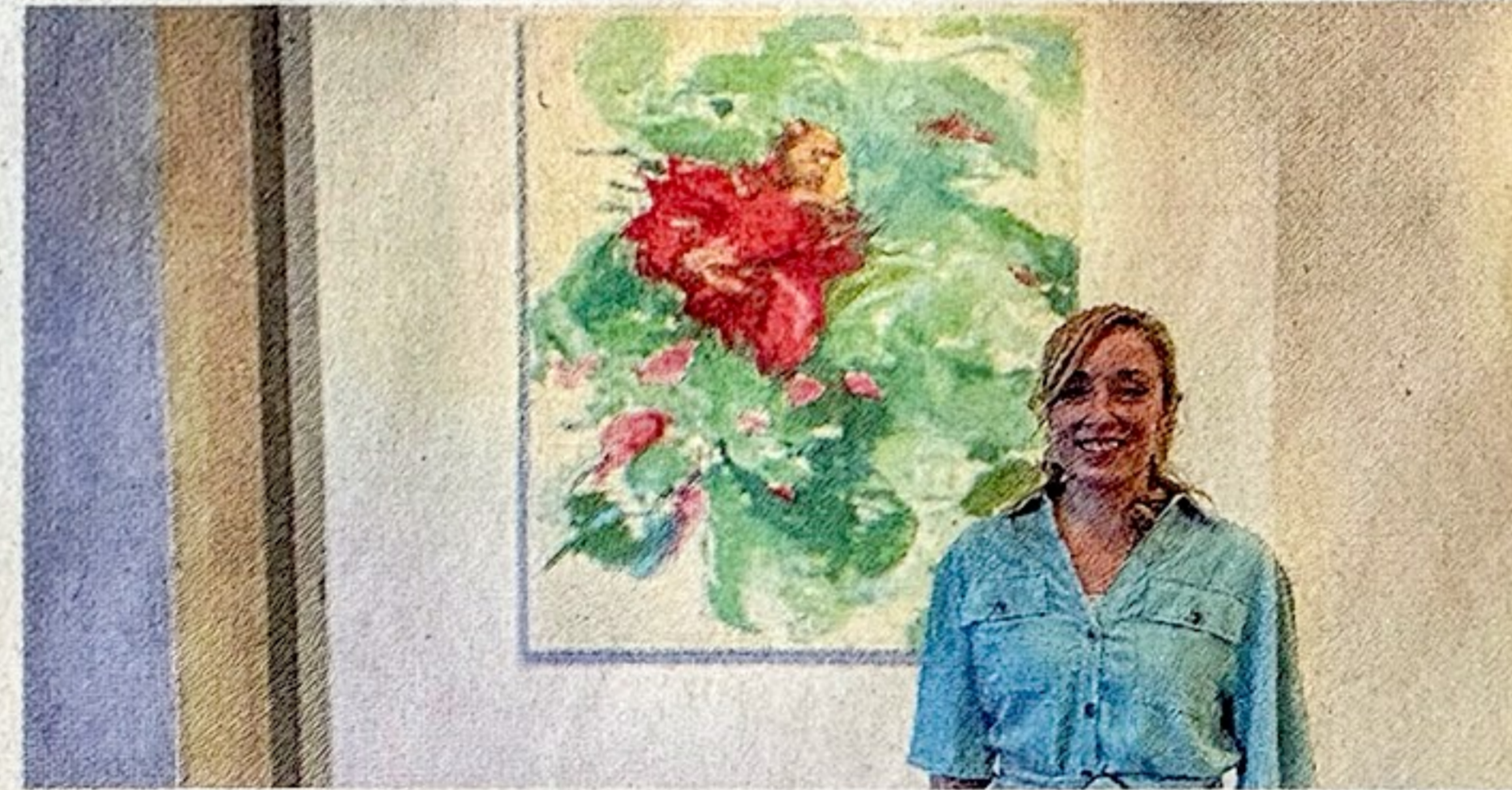
Die Künstlerin Lydiane Lutz konnte mit diesem Gemälde das Publikum von ihrer Arbeit überzeugen.

Die Stimmen des Publikums hätten gezeigt, dass es vor allem zwei Werken gelang, die Betrachter besonders anzusprechen. Diese zwei Werke lagen in der Auszählung genau gleich auf, sodass